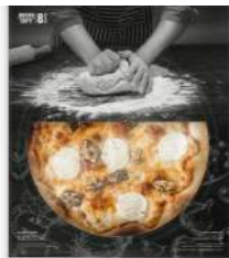
Pizza Fina Queso de cabra y nueces *Nuevo