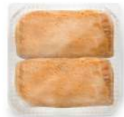
Librito mixto 2u