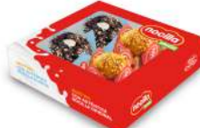
Túlipe Nocilla 4 u