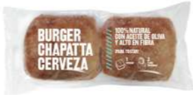
60028 Burger Chapatta Cristal Cerveza 4u 16 bolsas x 2u | 186 g