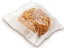
67990 Burger Sin Gluten