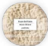
Base Pizza Masa Clásica 3u *Nuevo