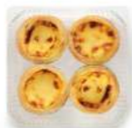
Pastel de Nata 4u