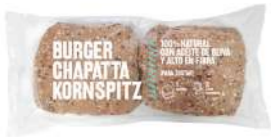
60027 Burger Chapatta Cristal Kornspitz 4u 16 bolsas x 2u | 186 g