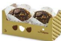
Túlipe Choc Extrem 2u