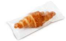
62715 Croissant Sin Gluten