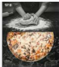
Pizza Fina Bacon y Champiñones Portobello *Nuevo