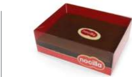
62235 Tarta Cuadrada Nocilla 4 u | 410g