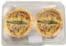
Quiche de Espárragos con jamón 2u