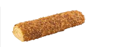
16420 Brazo de Crema 4 u | 850g