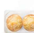
Bolo de arroz