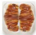
Brioche Choco 2u