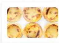
Pastel de Nata 6u