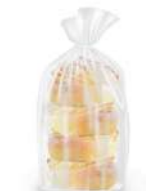
Pao de Deus