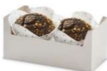
69915 Túlipe Choc Extrem 2u