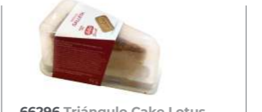
66296 Triángulo Cake Lotus 20 u | 75g *Nuevo