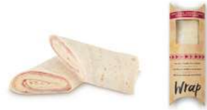
64565 Wrap Jamón y Queso