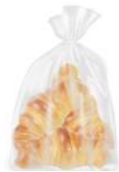
Croissant Brioche 3u