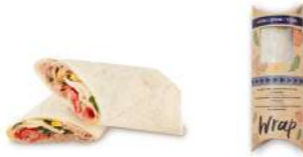
64575 Wrap Atún