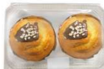
Big Túlipe White 2u