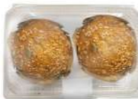
Big Túlipe Muesli 2u