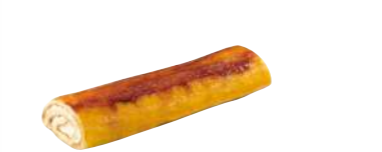
16421 Brazo de Yema 14 u | 500t g