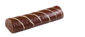
16426 Brazo de Trufa 4 u | 500g