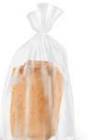
Librito mixto 2u