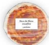
Base Pizza Masa Fina 3u *Nuevo