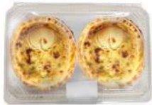
Quiche 3 Quesos 2u