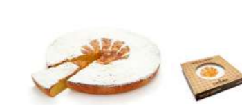
93100 Tarta de Almendras 370g 6 u | 370g