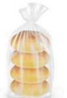
Brioche de leche