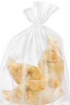
Empanada Argentina Pollo 3u