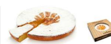
16100 Tarta de Almendras 4 u | 600g