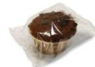
62710 Muffin de Choco Sin Gluten