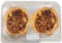
Quiche Mixta 2u