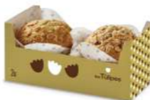
Túlipe Cranberry Yoghurt 2u