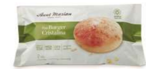
69835 Burger Cristalina