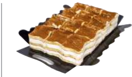
67403 Delicia Tiramisú 1 u | 735g