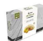
Gyoza Pollo y brocoli