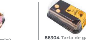
86304 Tarta de galletas 8 u