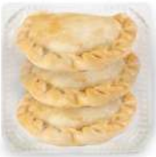
Empanada Argentina Carne 3u