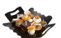
39120 Pastel Mini Surtido 21x12 u | 275t g