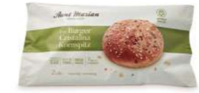
69855 Burger Cristalina Kornspitz