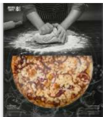
Pizza Fina Barbacoa *Nuevo