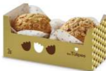
Túlipe Cranberry Yoghurt 2u