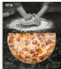
Pizza Fina Jamón cocido y Cheddar *Nuevo