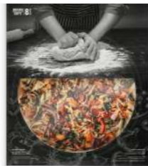
Pizza Fina Vegana *Nuevo