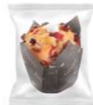
Túlipe formato individual