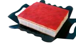
17319 Tarta Cuadrada Queso y Nata 4 u | 410g