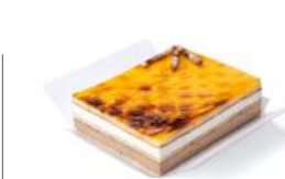
69832 Tarta San Marcos 4 u | 430g