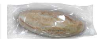
Media Fully Baked