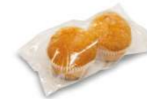
62301 Madalena Sin Gluten