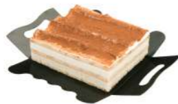
67303 Tarta Cuadrada Tiramisú 4 u | 390g