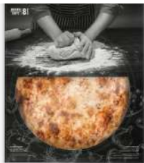
Pizza Fina Margarita *Nuevo