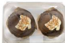
Big Túlipe Dark 2u