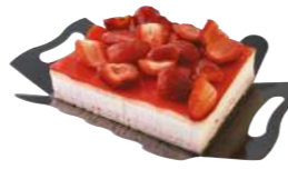
67520 Tarta Cuadrada Nata y Fresa 4 u | 485g