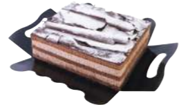
67304 Tarta Cuadrada Selva Negra 4 u | 405g