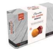
Croqueta Gambas al Ajillo