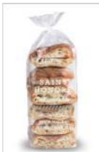
64965 Cristalino SH 6 x 6 u | 50 g