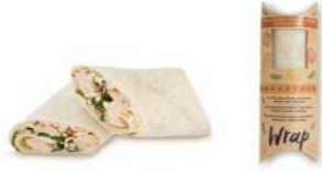
64555 Wrap Pollo asado