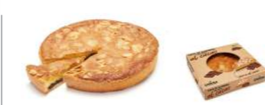
93103 Tarta Almendras y Cacao 6 u | 530g