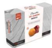
Croqueta Jamón Ibérico