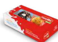
Túlipe Nocilla 2 u