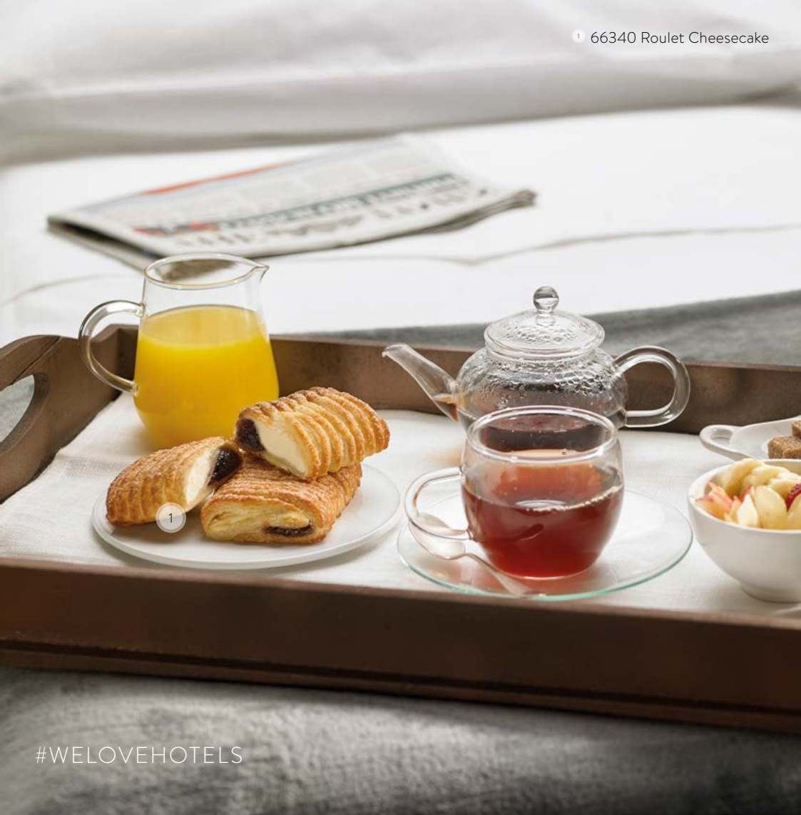
1 66340 Roulet Cheesecake