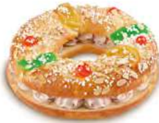
68270 Roscón Trufa Listo