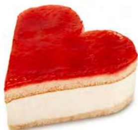
68631 Tartaleta Corazón de Queso y Fresa

Estas dos pequeñas tartaletas con forma de corazón son ideales para compartir: la preferida de los amantes de las especialidades al cacao, con tres cremosas y dulces capas, y la vestida de fresa rojo pasión, que incorpora un exquisito relleno de cheesecake.