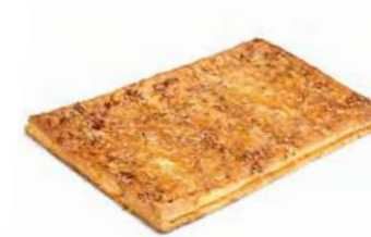
00876 Coca de Hojaldre de Cabello de Ángel 1kg