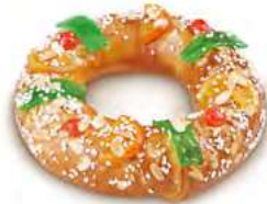
68231 Roscón Mediano Listo