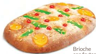
Brioche con frutas