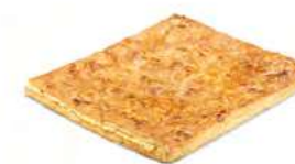
24760 Coca de Hojaldre de Crema 500g