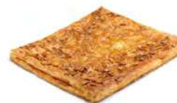
24750 Coca de Hojaldre de Cabello de Ángel 500g