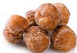
40480 Buñuelos de Viento Listos

Dos formatos distintos, una misma delicia de especial demanda durante la Cuaresma. Elaborados con nuestra exquisita masa escaldada, que les confiere un exterior crujiente y un interior deliciosamente burbujeante, los buñuelos de la familia Listos están, además, ya fritos y rebozados en azúcar para proporcionarles su característico sabor.