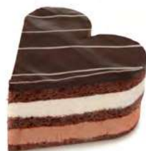
69941 Tartaleta Corazón Tres Caprichos