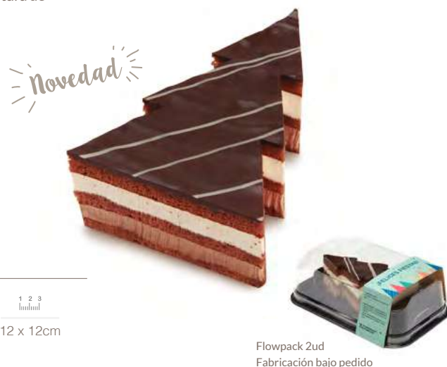
67537 Tartaleta Árbol de Navidad

Te ofrecemos nuestra irresistible Tartaleta Árbol de Navidad en su vistosa caja de presentación. Con forma de abeto, su dulce interior esconde una capa de nata y otra de crema al cacao, mientras que su cobertura de chocolate le da un aspecto muy apetitoso.