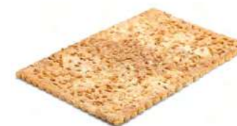
00880 Coca de Chicharrones 1kg