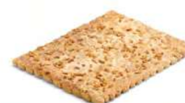
00815 Coca de Chicharrones 500g