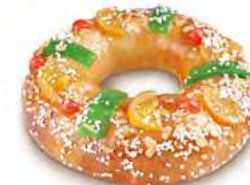
68020 Tortel con Fruta 600g