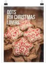
Navidad Dots 2