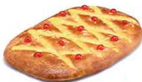
90310 Coca de Crema 90320 1 1,4kg Lista