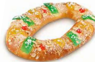
40883 Roscón Grande