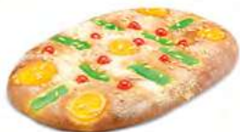
90050 Coca de Fruta 90060 1 Grande Lista