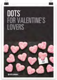
San Valentín Dots 1