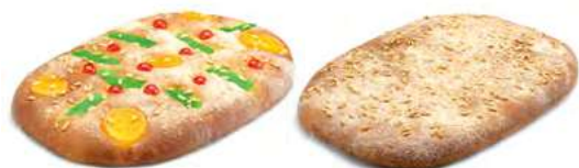
24250 Coca de Brioche con Fruta 1kg 24400 1 Coca de Brioche sin Fruta 950g