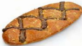
90010 Coca Bombón 90020 1 Mediana Lista