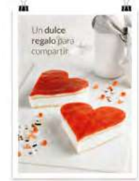
San Valentín Tarta 1