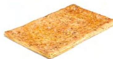
00879 Coca de Hojaldre de Crema 1kg