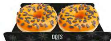
Flowpack 2ud Fabricación bajo pedido