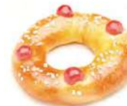
40870 Roscón Mini