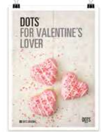
San Valentín Dots 2