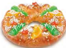
40885 Tortel Mediano Listo