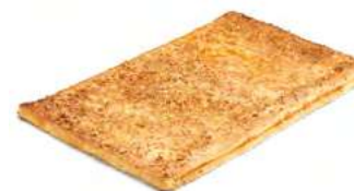
00878 Coca de Hojaldre de Crema y Cabello de Ángel