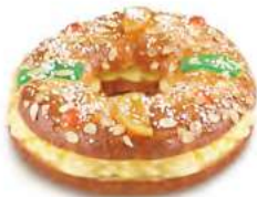
68770 Roscón con Crema Listo