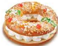
69050 Roscón Pequeño Nata Listo