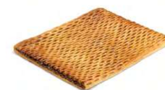
10875 Coca de Hojaldre