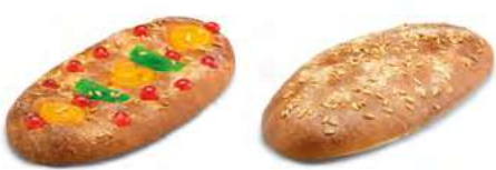
24300 Coca de Brioche con Fruta 500g 24450 1 Coca de Brioche sin Fruta 500g