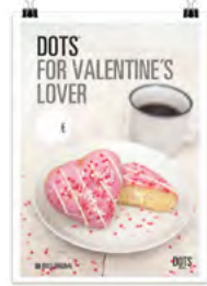
San Valentín Dots 3