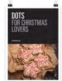
Navidad Dots 1