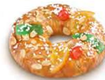
68040 Tortel con Mazapán y Fruta 335g