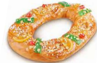
68060 Tortel con Mazapán y Fruta 920g