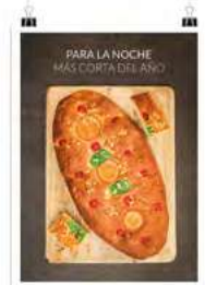
San Juan 2