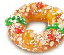
00881 Roscón Pequeño