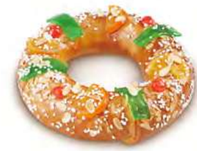
68025 Roscón Mediano