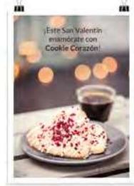
San Valentín Cookie