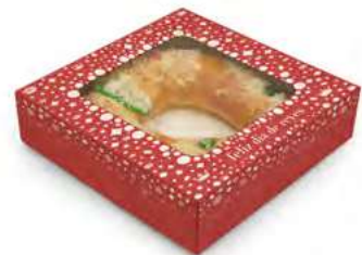
Cajas para cada Roscón