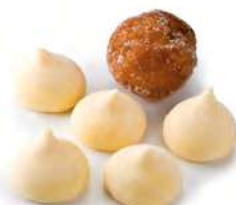
00891 Buñuelos de Viento