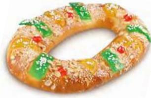
68310 Roscón Grande Listo