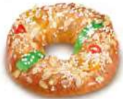
68450 Roscón Pequeño Listo