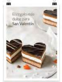
San Valentín Tarta 2