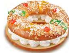
68241 Roscón Nata Listo