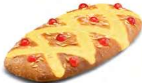
90140 Coca de Crema 90040 1 670gr Lista