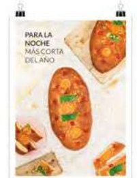
San Juan 1