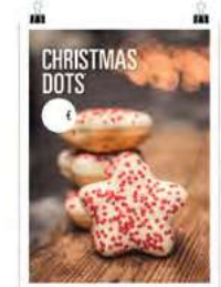
Navidad Dots 3