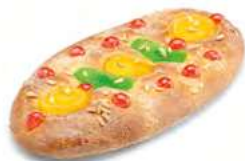
90080 Coca de Fruta 90070 1 Mediana Lista