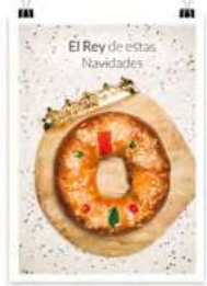
Día de Reyes