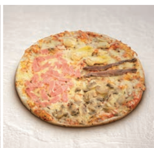
Pizza Quattro Stagioni

10 uds/caja • 390 g/ud 8/10 min. horno a 200°C*