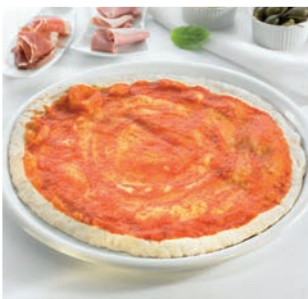
Base de pizza redonda artesana

8 uds/caja • 1.000 g/ud 6/8 min. horno a 200°C*