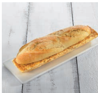
Tortilla de patatas

15 uds/caja • 235 g/ud 4/6 min. grill/horno a 180°C*