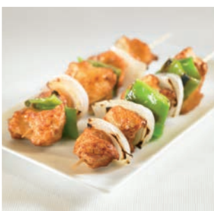
Brochetas de pollo con verduras