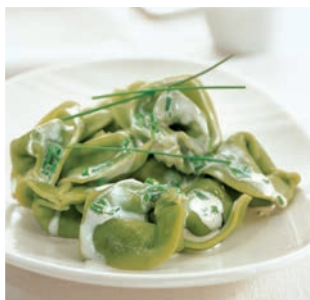
Tortellini Ricotta e Spinaci