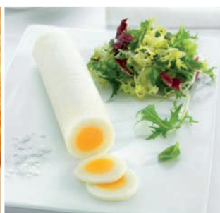
Huevo duro en barra

5 uds/caja • 1.200 g/ud Descongelar 24 h. en nevera y 5 min. microondas a 900 W*