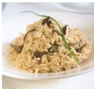
Risotto ai Funghi

Dos brochetas 3 min. microondas a 900 W*