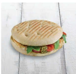
Rodado Pollo, Mayonesa, Pesto, Tomate, Rucula

22 uds/caja · 205 g/ud Descongelar 120/180 min 4/6 min. horno a 190/200°C 2/4 min. plancha