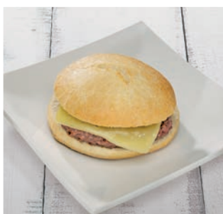
Mollete de hamburguesa con queso