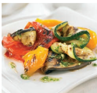
Verduras a la brasa