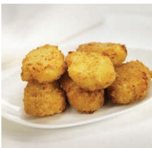
Nuggets de queso de cabra