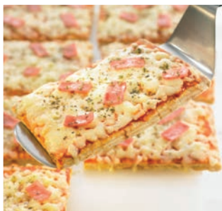
Pizza Prosciutto e Formaggio