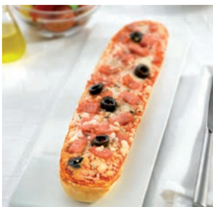
Baguette-pizza de York

30 uds/caja • 130 g/ud 6/8 min. horno a 200°C*