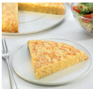
Tortilla de patatas

20 uds/caja • 750 g/ud Descongelar 12 h. en nevera y 6/8 min. microondas a 900 W*