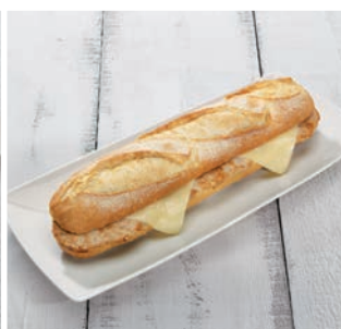
Lomo de cerdo con queso

15 uds/caja • 200 g/ud 4/6 min. grill/horno a 180°C*