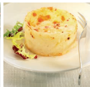
Gratinado de patatas

10 uds/caja • 800 g/ud Descongelar 12 h. en nevera y 6/8 min. microondas a 900 W*