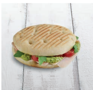
Rodado Pavo, Guacamole y Tomate Cherry