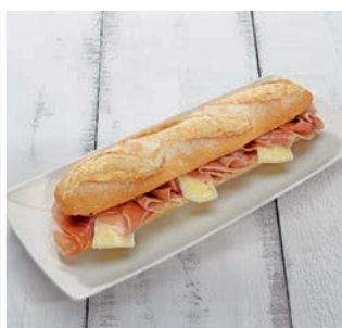
Jamón y queso

15 uds/caja • 185 g/ud 4/6 min. grill/horno a 180°C*