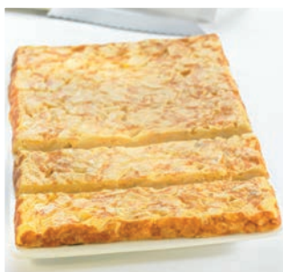
Placa de tortilla

10 uds/caja • 300 g/ud 7/8 min. microondas 850 W* o 12 h. en nevera*