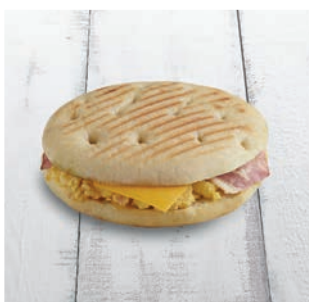
Rodado Mixto con Huevo Revuelto

14 uds/caja · 190 g/ud 4/6 min. grill/horno a 180°C*