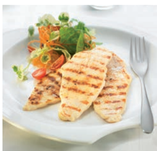
Escalopines de pechuga de pollo