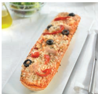
Baguette-pizza de Atún

25 uds/caja • 230 g/ud 6/8 min. horno a 200°C*