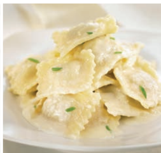
Ravioli Quattro Formaggi