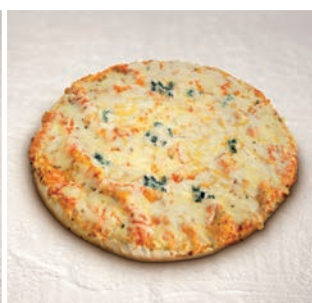
Pizza Quattro Formaggi

10 uds/caja • 390 g/ud 8/10 min. horno a 200°C*