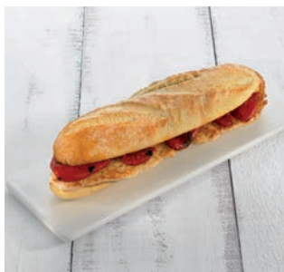
Pollo con pimientos

15 uds/caja • 220 g/ud 4/6 min. grill/horno a 180°C*