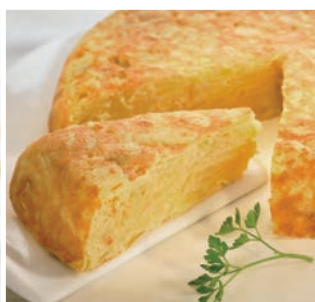
Tortilla de patatas con cebolla

4 bolsas/caja • 1.000 g/bolsa Una ración 4 min. microondas a 900 W*