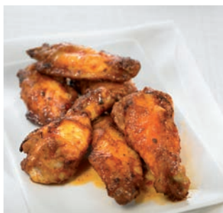
Alitas de pollo Barbacoa