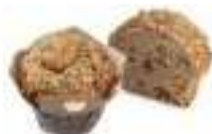
Big Muffin Tulip Muesli