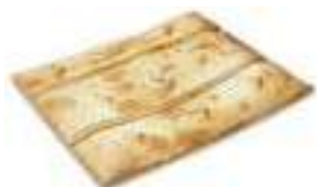
65780 Empanada de Galice au Thon