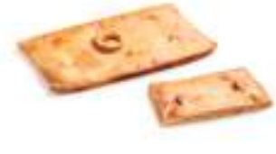
65310 Empanada au Thon

6 u 1,6 kg 8x9 20-30' 180-200° 30-40' 37 cm