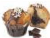
Big Muffin Tûlpe Choc Blanc