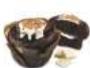
Big Muffin Tûlpe Choco

* Les temps de cuisson et de décongélation sont fournis à titre indicatif, car ils dépendent des conditions et de la température de chaque local.