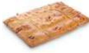
65770 Empanada au Thon cuite