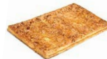
00876 Coca de Hojaldre de Cabello de Ángel 1kg