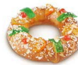
68025 Roscón Mediano