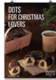
Navidad Dots 2