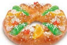
40885 Tortel Mediano Listo