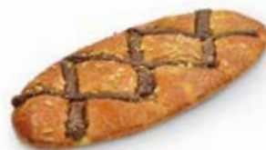
90010 Coca Bombón 90020 1 Mediana Lista