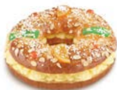
68770 Roscón con Crema Listo