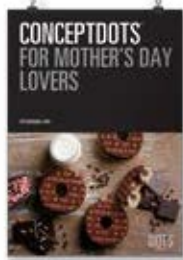
Día de la Madre 1