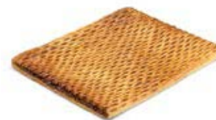
10875 Coca de Hojaldre