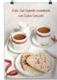
San Valentín Cookie