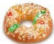
68450 Roscón Pequeño Listo