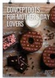
Día de la Madre 2