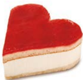
68631 Tartaleta Corazón de Queso y Fresa

Te presentamos dos pequeñas tartaletas con forma de corazón, ideales para compartir entre dos: la preferida de los amantes de las especialidades al cacao, con tres cremosas y dulces capas, y la vestida de fresa rojo pasión, que incorpora un exquisito relleno de cheesecake. ¿Por cuál optar? ¡Mejor por ambas!