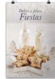
Navidad Cookie Estrella