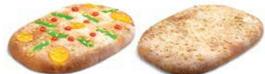
24250 Coca de Brioche con Fruta 1kg 24400 1 Coca de Brioche sin Fruta 950g