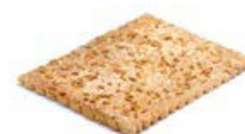
00815 Coca de Chicharrones 500g