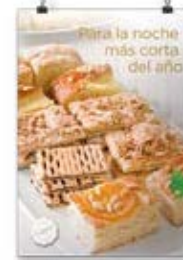
San Juan 1