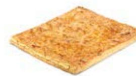
24760 Coca de Hojaldre de Crema 500g