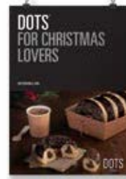
Navidad Dots 1