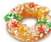
00881 Roscón Pequeño