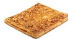
24750 Coca de Hojaldre de Cabello de Ángel 500g