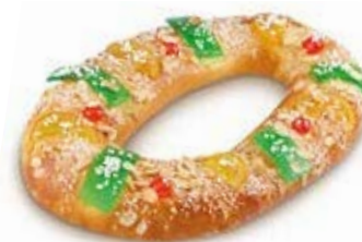
40883 Roscón Grande