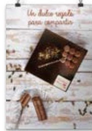
Día de la Madre 4