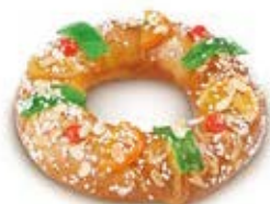
68231 Roscón Mediano Listo