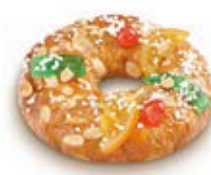
68040 Tortel con Mazapán y Fruta 335g