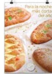
San Juan 2