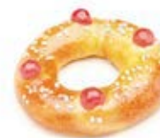
40870 Roscón Mini