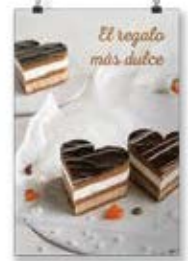
San Valentín Tarta 2