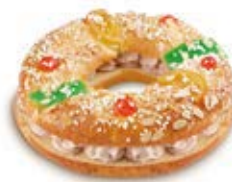
68270 Roscón Trufa Listo