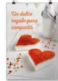
San Valentín Tarta 1