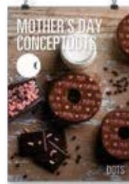
Día de la Madre 3