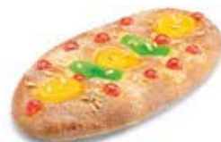
90080 Coca de Fruta 90070 1 Mediana Lista