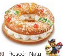
68360 Roscón Nata Patrulla Canina