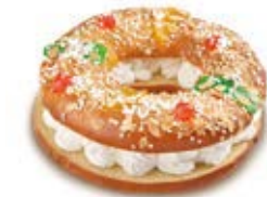
68241 Roscón Nata Listo