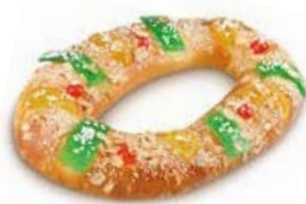
68310 Roscón Grande Listo