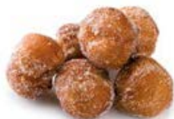
40480 Buñuelos de Viento Listos

Dos formatos distintos, una misma delicia de especial demanda durante la Cuaresma. Elaborados con nuestra exquisita masa escaldada, que les confiere un exterior crujiente y un interior deliciosamente burbujeante, los buñuelos de la familia Listos están, además, ya fritos y rebozados en azúcar para proporcionarles su característico sabor.