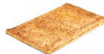
00878 Coca de Hojaldre de Crema y Cabello de Ángel