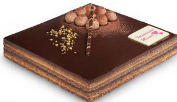
63040 Tarta Día de la Madre

Un día tan especial se merece una celebración en familia. Nuestra exquisita tarta de praliné, trufa y bizcocho de chocolate, además de estar envasada individualmente, está personalizada con una etiqueta de bombón blanco que felicita a mamá en su día. ¡Qué dulce regalo para compartir!