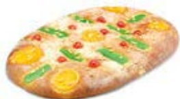
90050 Coca de Fruta 90060 1 Grande Lista