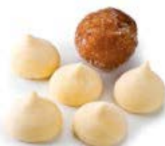
00891 Buñuelos de Viento