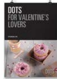
San Valentín Dots 1