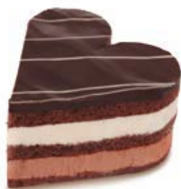
69941 Tartaleta Corazón Tres Caprichos