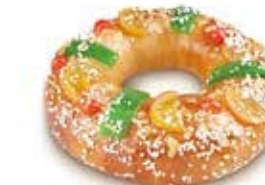
68020 Tortel con Fruta 600g