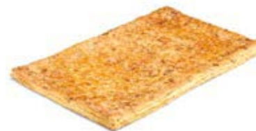
00879 Coca de Hojaldre de Crema 1kg