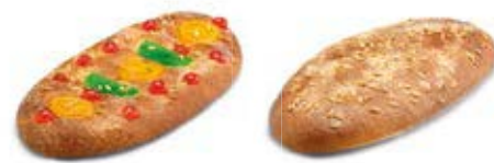
24300 Coca de Brioche con Fruta 500g 24450 1 Coca de Brioche sin Fruta 500g