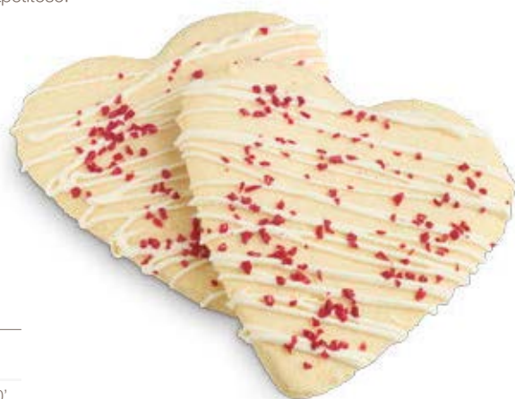
63680 Cookie Corazón

Elaboramos nuestra cookie más coqueta con mantequilla y le damos forma de corazón para celebrar el día del amor. Su decoración, con un rayado de bombón blanco y un toque de virutas de frambuesa, le proporciona un aspecto todavía más apetitoso.