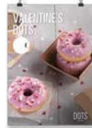
San Valentín Dots 3