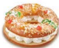
69050 Roscón Pequeño Nata Listo