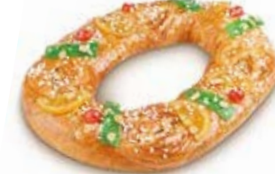
68060 Tortel con Mazapán y Fruta 920g