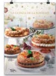
Día de Reyes