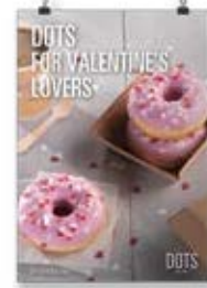
San Valentín Dots 2