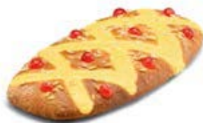
90140 Coca de Crema 90040 1 670gr Lista