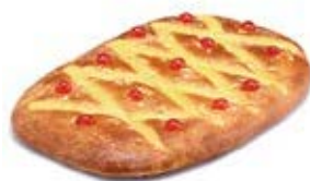
90310 Coca de Crema 90320 1 1,4kg Lista