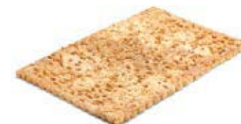
00880 Coca de Chicharrones 1kg