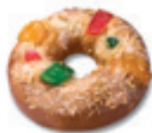
68450 Roscón Pequeño Listo