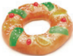
68025 Roscón de Reyes 500g