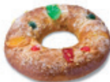
68231 Roscón Mediano Listo