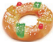
00881 Roscón Pequeño