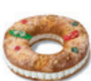
69050 Roscón Pequeño Nata Listo (450g)