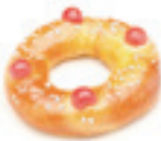
40870 Roscón Mini 125g