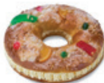
68770 Roscón con crema Listo