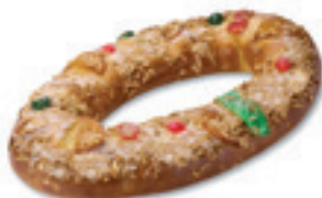
68310 Roscón Grande Listo