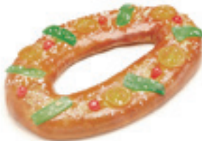
40883 Roscón de Reyes 1kg