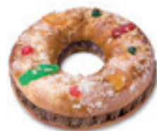
68270 Roscón con Trufa Listo