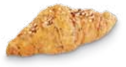
23720 Mini Croissant París Cereales 25 g | 9 cm