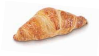
24910 Croissant París Crema 72 g | 13 cm 24% mantequilla