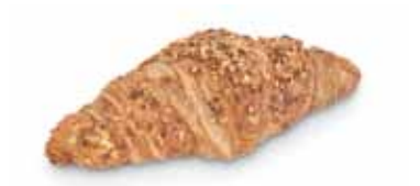
22180 Croissant de Cereales 80 g | 13 cm 24% mantequilla