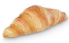
22132 Mini Croissant París 25 g | 9 cm