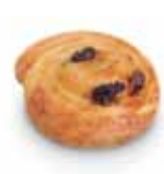
21790 Mini Snecken París 30 g | 5,5 cm