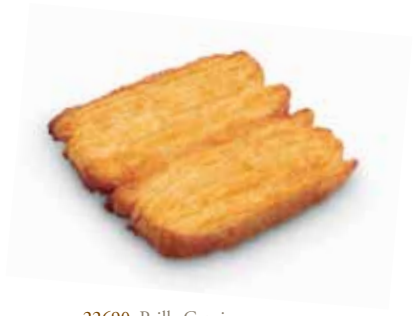
22690 Paille Caprice 90 g | 20x13 cm