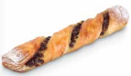
29980 Torsade Caprice 90 g | 22,5 cm