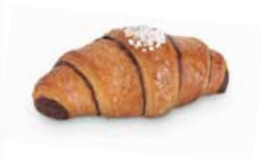
20190 Croissant Caprice 87 g | 12 cm