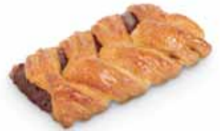
22010 Trenza de Chocolate con Leche 127 g | 13 cm 40% mantequilla