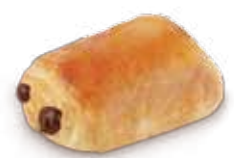
22175 Napolitana París 70 g | 8 cm 24% mantequilla