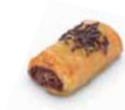
21260 Mini Roulet Choco 22 g | 5,8 cm