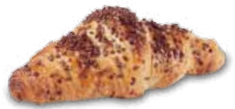
22080 Croissant París Chocolate 72 g | 13,5 cm 24% mantequilla