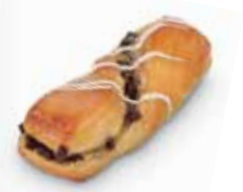
21800 Mini Torsade Caprice 28 g | 10 cm