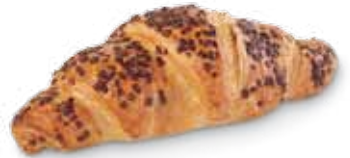
23710 Super Croissant París Choco 90 g | 14,5 cm 24% mantequilla