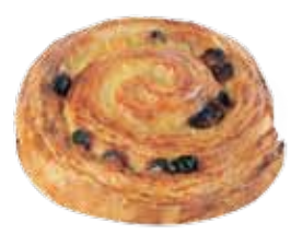
20130 Snecken Caprice 100 g | 11 cm