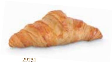
29231 Croissant París Mantequilla 60 g | 14 cm 24% mantequilla