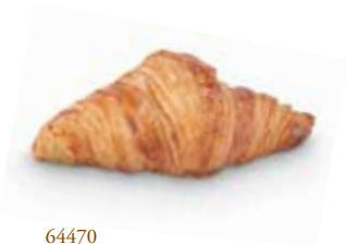
64470 Croissant París Hotelero 45 g | 10,5 cm 24% mantequilla